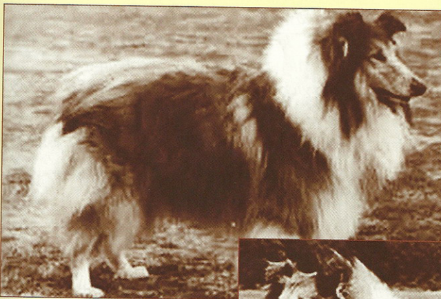
Ch. Brettonpark Whatzízname (*19. 03. 1921) - ďalší z radu hviezdnych potomkov Dazzlera. Bol synom Ramsay of Rokeby, no Dazovu krv viedol aj po matke Brettonpark Vanity Fair, ktorá bola Dazzlerovou dcérou. Tento pes tiež zanechal neprehliadnuteľné stopy v chove kólií.