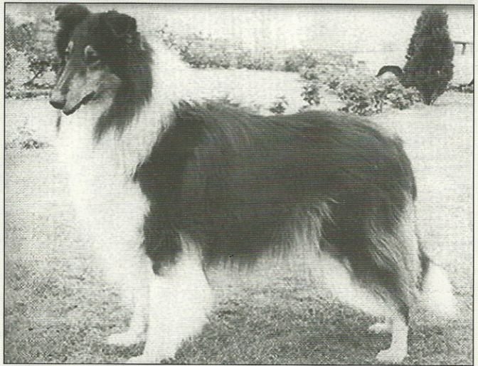
Ch. Witchcraft of Rokeyby - prvá Dazova nevesta, vďaka ich spoločnému potomstvu bola odštartovaná hviezdna Dazzlerova kariéra