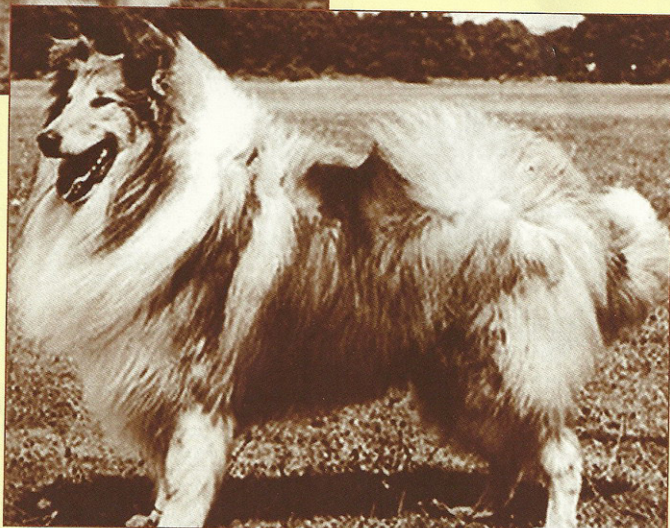
Ch. Aberthorne Arrester (*19. 04. 1976) pochádza takisto z líniovej plemenitby vedenej na Dazzlerovi. Bol nielen krásny, ale mal aj nadmieru vyrovnanú a sebavedomú povahu, ktorú odovzdával aj svojmu potomstvu (zlé jazyky hovoria, že spolu s ním mieru veselo neseným chvostom). Arresterovi jeho potomkovia vďaka i za bohatosť srsti.

Zaroveň však mal dve obrovské prednosti. Prvou bol spomínaný rodokmeň a druhou na tú dobu (keď sa chov potýkal