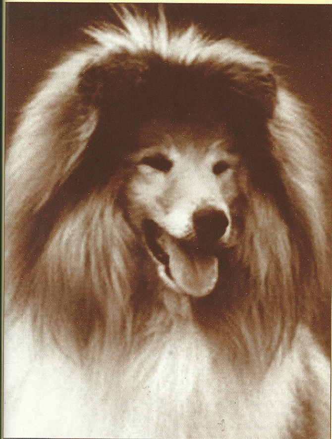
Ch. Brilyn Supertramp (*02. 7. 1979) - rodokmeň slávneho Supertrampa je zložený zo samých legendárnych potomkov Dazzlera (Ch. Ramsay of Rokeby, Ch. Braitonpark Whatzname, či Abberthorne Arrester). Tento nesmierne kvalitný pes mal Dazzlera vo svojom rodokmeni až neuveriteľných 18x!