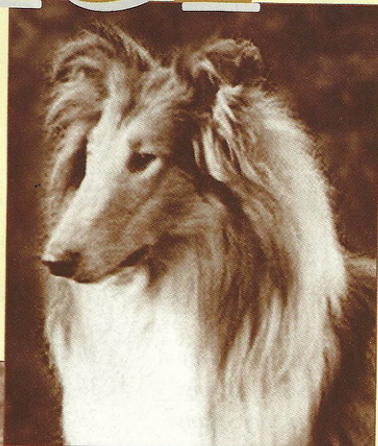
Dazzler of Dunsinane (*14. 06. 1962) - nenápadný pes, ktorý sa stal ťažko prekonateľnou legendou chovu dlhosrstých kólií.