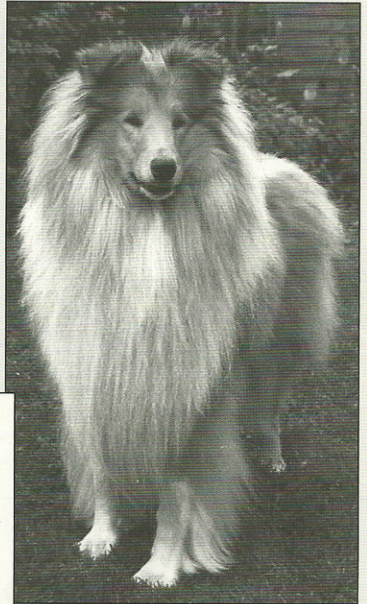
Ch. Brilyn Supertramp

Dazzlerovo meno má v rodokmeňoch nesmierne množstvo kólií. Zaujímavý je bezpochyby fakt, že napriek silnej a často využívanej príbuzenskej plemenitbe to nemalo negatívny vplyv na zdravie jeho potomkov.