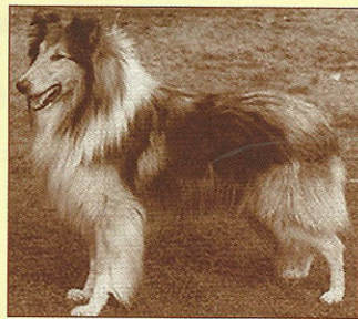
Ch. Ramsay of Rokeby (*04. 6. 1966) patrí k slávnym potomkom Dazzlera a zároveň k významným plemenníkom v chove. Pochádza z úzkej príbuzenskej plemenitby, keď jeho matka, Ch. Romney of Rokeby (dcéra Dazzlera a Ch. Witchcraft Rokeby), bola opäť nakrytá svojím otcom Dazzlerom.