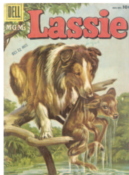
Dobrodružstvá s Lassie vychádzali aj v časopisoch v rôznej forme