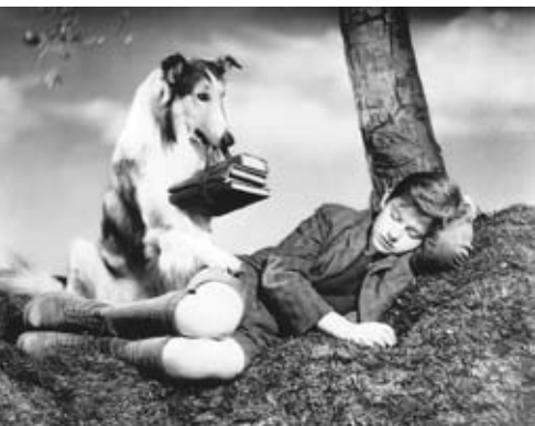
Hlavní predstavitelia filmu Lassie sa vracia – Lassie (Pal) a Joe Carraclough (Roddy McDowal)

nicolor. Isto však vtedy netušili, že „Lassie sa vracia“ sa stane v kinematografii nezapudnuteľným medznikom. Samotný film bol nominovaný na Oscara za najlepšiu kameru a farbu a v roku 1993 bol vybraný na uchovanie do národného filmového registra kongresu pre jeho historicky dôležitú kultúrno-estetickú hodnotu. Vtedy neznámym detským hrdinom – Elizabeth Taylor a Roddymu McDowalovi zabezpečil nielen rozbeh filmovej kariéry, ale aj nesmrteľnú slávu. A Lassie? Tá má ako jedna z mála zvierat hviezdu na hollywoodskom chodníku slávy. Zvykne sa hovoriť, že Lassie pre svoje plemeno urobila viac, ako ktorýkoľvek iný pes na svete.