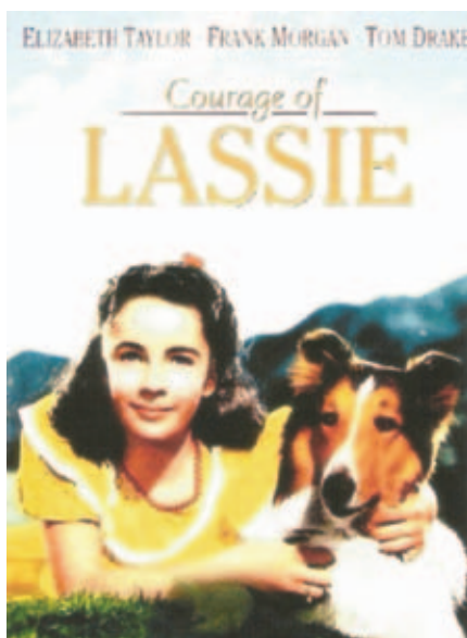
Upútavka na jedno z ďalších pokračovaní príbehov s Lassie