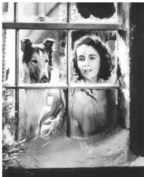
Hlboké precítenia deja možno cítiť nielen z knižnej predlohy, ale aj vo filmovom spracovaní. Na zábere Elizabeth Taylor a Lassie (Pal)