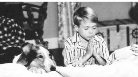
Ústredným motívom nielen filmu Lassie sa vracia, ale aj všetkých ďalších pokračovaní je vždy vernosť a oddaná láska Lassie ku svojim majiteľom

Filmové spracovanie „Lassie sa vracia“ videli milióny divákov po celom svete. Jeho slávnostnej premiéry sa však nedožil samotný autor knihy Eric Knight. V roku 1942 mu premietli ukážky z filmu, aj sa stretol s Palom, no hotový produkt nestihol vidieť. Tragicky zahynul pri leteckom nešťastí počas druhej svetovej vojny v roku 1943. Tento anglický spisovateľ žijúci v USA napísal veľa krásnych s citom napísaných poviedok, no preslávil sa práve podmanivým príbehom o Lassie. Námetom k jeho napísaniu bola Toots, súč-