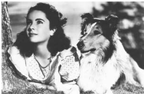
Vo filme si zahrála aj vtedy mladá a neznáma Elizabeth Taylor