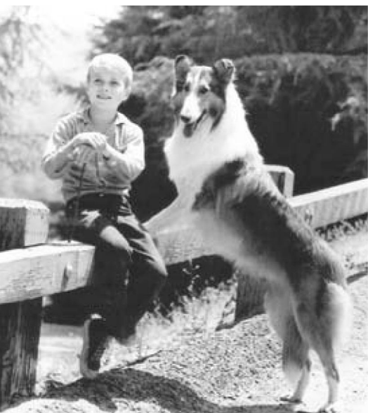
Veľký úspech dosiahol aj seriál o dobrodružstvách Timmyho a Lassie. Na televízne obrazovky vstupoval neuveriteľných 19 rokov