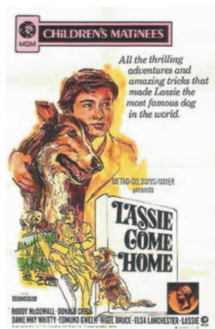
Ďalší z plagátov ku známemu filmu

Úspech filmu „Lassie sa vracia“ prekonal všetky očakávania. Po ňom nasledovalo 11 ďalších televíznych pokračovaní, stovky epizód, televíznych šou, rozhlasových spracovaní, či tlačných komiksov. Lassie sa ešte po ďalšie desaťročia stala mediálnou značkou a ikonou šoubiznisu. Milovali ju deti, aj dospelí.