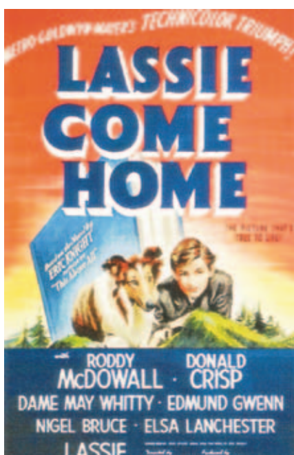
Poster k filmu Lassie sa vracia