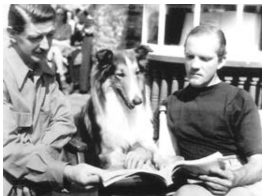
Filmovania sa zúčastnil aj autor knihy Lassie sa vracia Eric Knight (vľavo). Na fotke s Palom a Fredom Wilcoxom – režisérom filmu Lassie sa vracia

Pal sa narodil 4. 6. 1940 v chovateľskej stanici Glamis v Kalifornii. Aj keď jeho rodokmeň siahal až k jednej z prvých známych kólií Old Cockiemu, už ako šteniatko bol predaný len ako domáci miláčik bez výstavného a chovného potenciálu. Stretnu-