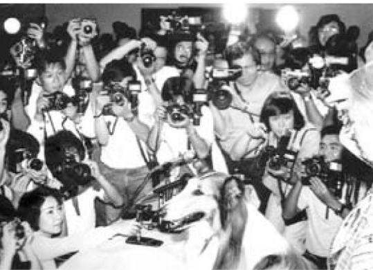
Dobrodružstvá kólie Lassie zaznamenali celosvetovú popularitu. Lassie na tlačovke v Tokiu