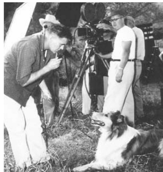
Pal počas nakrúcania filmu Výzva Lassie