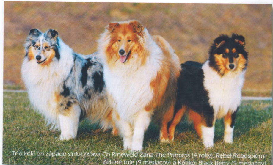
Trío kólií pri západe slnka /zľava Ch Rineweld Zaria The Princess (4 roky), Rebel Robespierre Zelené tuje (9 mesiacov), a Kókači Black Betty (5 mesiacov)

Kólia dlhosrstá je všestranne využiteľná, ľahko cvičiteľný pes, ktorého výchovu zvládne aj začiatočník. Učí sa rýchlo, s radosťou a naučené povely si pamätá už navždy. Starsšie jedince vedia vycítiť požiadavky majiteľa aj bez povelov, len na základe „reči tela“ svojho majiteľa. K výchove kólie je potrebné