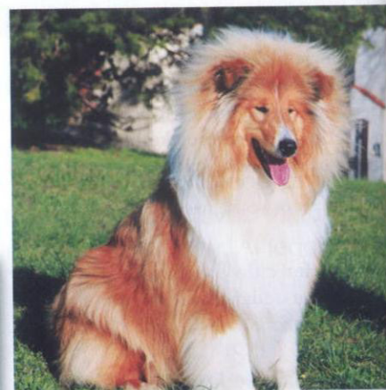
JCh Enigma Empress du Clos de Seawin

Miluje svoju rodinu doslova celým svojím srdcom. Kvôli svojej svedomitosti, lojálnosti a citlivosti je ideálnym rodinným psom. Je však vhodná pre každého, kto ju zodpovedne vie a chce prijať.