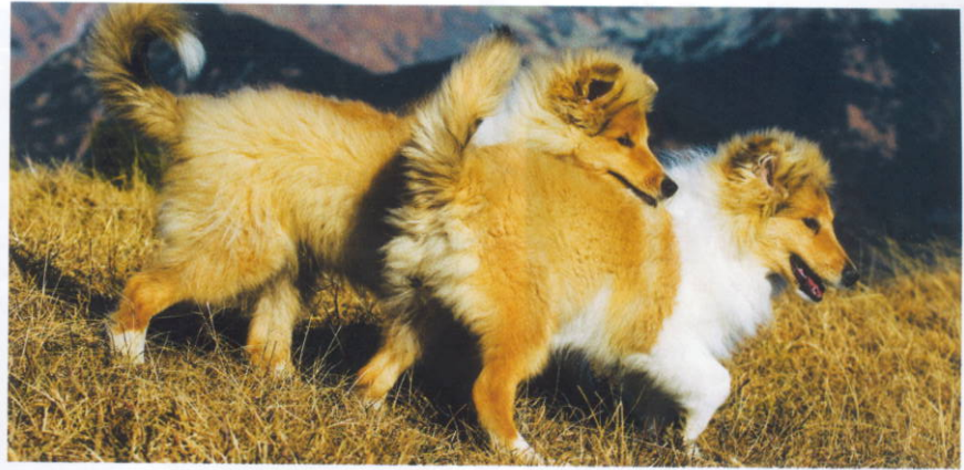
Šteniatka z vrhu „R“ Zelené tuje na lúkach v Západných Tatrách

Prešlo ešte zopár mesiacov a po jednej výstave v Brne, kde sme v silnej konkurencii zaznamenali náš prvý úspech, bolo jasné už aj to, že nebudeme len majiteľmi, ale aj chovateľmi. Prvý vrh sme v našej chovateľskej stanici Zelené tuje zaznamenali 20.10.1987.