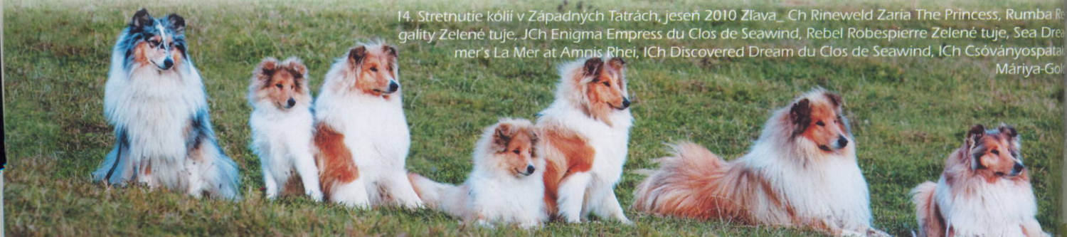
14. Stretnutie kólií v Západných Tatrách, jeseň 2010 Zľava... Ch Rineweld Zaria The Princess, Rumba Regality Zelené tuje, JCh Enigma Empress du Clos de Seawind, Rebel Robespierre Zelené tuje, Sea Dreamer's La Mer at Amnis Rhei, Ich Discovered Dream du Clos de Seawind, Ich Csóványospatak Mária-Gold

Prvé kólie boli menšieho vzrastu, kratších nôh a pysku, mali výraznejší stop, nad chrbátom