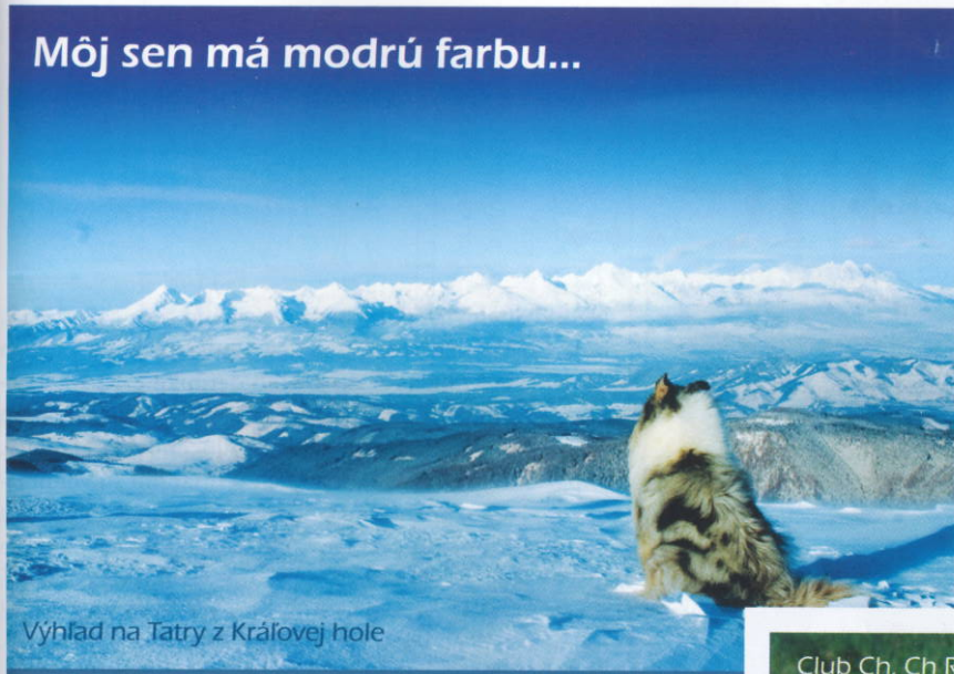
Výhľad na Tatry z Kráľovej hole