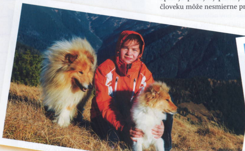
ICH. Discovered Dream du clos de Seawind a Rumba Regality Zelené Tuje na vrchole vrchu Babky 1566 m n.m. v Západných Tatrách.

V mladosti som mala to šťastie, že sestra dostala svojho prvého vytúženého psa – dlhosrstú kóliu. Preto, keď prišiel čas na psa pre moje deti, nemala som pochyby o svojom rozhodnutí pre kóliu. Tieto pochybnosti mal manžel, ktorý dovtedy choval poľovne upotrebitelných psov, avšak po prvých týždňoch sa mu rozplynuli a dnes je šťastný, že máme doma svorku samostatne mysliacich a chytrých psov, ktoré sa vedia vcítiť do našich pocitov.