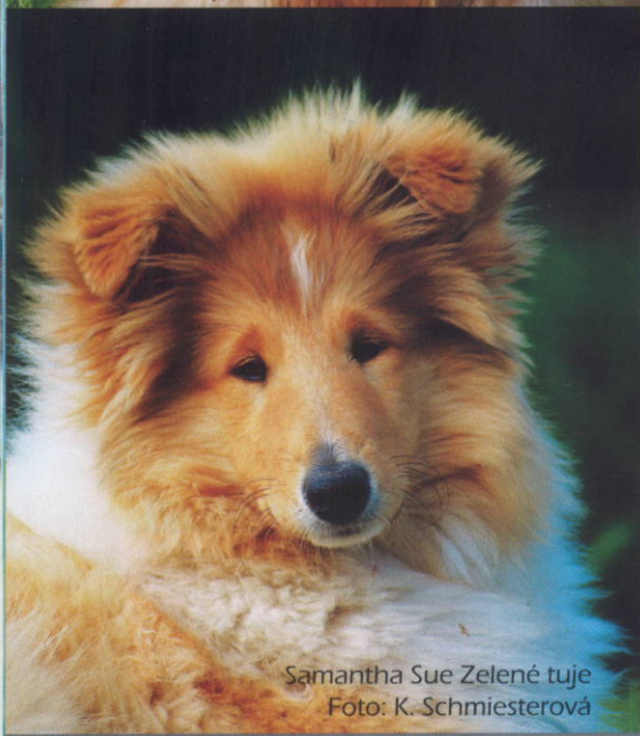
Samantha Sue Zelené tuje

Kólia dlhosrstá budí pozornosť svojim atraktívnym zjavom, avšak najväčšou prednosťou tohto psieho krásavca je bezpochyby jeho povaha. Hlavne vďaka nej bola kólia po stáročia vysoko cenená vo svojej domovine na Škótskej vysočine, kde si plnila úlohy ovčiarskeho psa. Práve obdiv k povahe a pracovným schopnostiam viedli kráľovnú Viktóriu k jej pozdvihnutiu od stád oviec na anglický kráľovský dvor. Aj legendárna Lassie okúzliла vtedajší svet svojimi schopnosťami – inteligenciou, vernosťou k rodine, vytrvalosťou a dobrou pamäťou. A to sú presne vlastnosti, ktoré z tohto plemena robia v dnešnej dobe ideálneho rodinného psa.