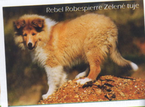
Rebel Robespierre Zelené tuje

Chovateľská stanica Zelené tuje Chovateľka, poradkyňa chovu, zakladajúci člen KCHKŠ, veterinárna lekárka, členka redakčnej rady veterinárneho časopisu Infovet , vedúca národného referenčného laboratória pre mlieko a mliečne výrobky v SR, vedúca DSL Nitra pri ŠVPÚ Bratislava