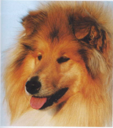
Rumba Regality Zelené tuje – 9 mesiacov

Keď mi otec v roku 1986 po mnohoročných prosbách kúpil môjho prvého psa – dlhosrstú kóliu, určite netušil, aké bude mať toto jeho rozhodnutie ďalekosiahle následky. Nielenže sú kólie dodnes členmi našej užšej i širšej rodiny, ale nepriamo ovplyvnili aj mnohé skutočnosti z môjho života. Teda aj to, že som sa stala veterinárnou lekárkou. Pritom, ak by sa ma niekto v období ešte pred kúpou psa spýtal na môj ideál psieho plemena, viem isto, že kóliu by som určite nespomenula. Vo svojej mysli, vtedy dvanásťročného dieťaťa roky snívajúceho o psovi, som jej totiž neverovala žiadnu pozornosť.