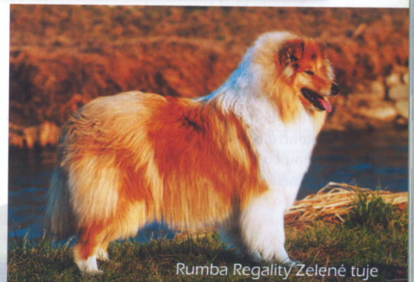
Rumba Regality Zelené tuje

Zrejme by schopnosť, výdrž a inteligencia holywoodskej Lassie nezapôsobila v takej miere na širokú verejnosť, ak by zároveň neupútala aj oko diváka svojou krásou. Vďaka elegantnosti, ktorú jej dodáva srst bola kólia niekoľkokrát vynesena do výšin celosvetovej popularity. No toľko obdivovaná srst zároveň budí strach u niektorých potencionálnych záujemcov o plemeno. Avšak rozhodovať sa pre alebo proti plemenu len kvôli dlhej srsti nie je tou správnou cestou.