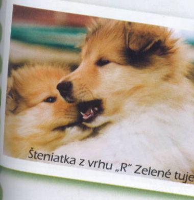
Šteniatka z vrhu „R“ Zelené tuje