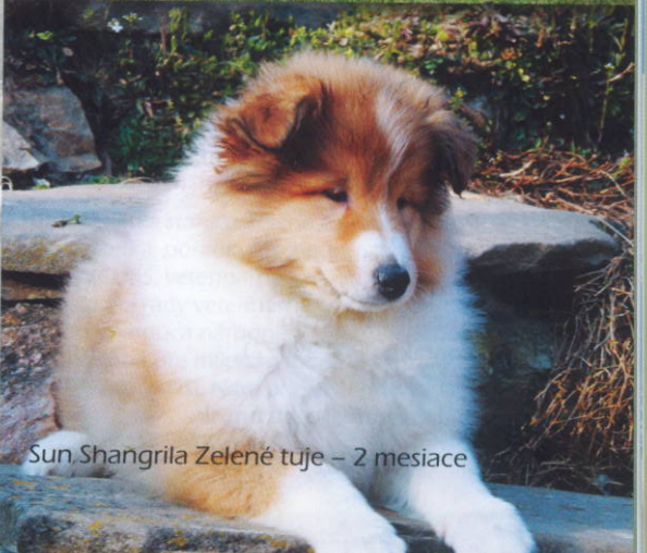
Sun Shangrila Zelené tuje – 2 mesiace