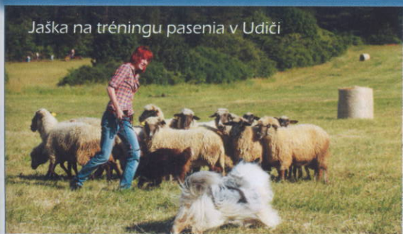
Jaška na tréningu pasenia v Udiči