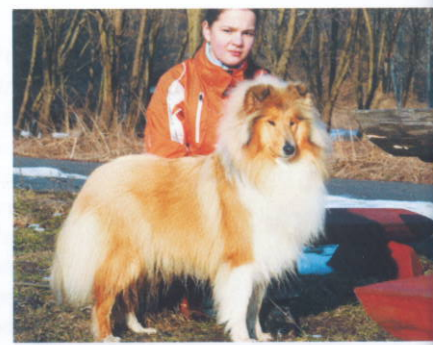
Sea Dreamer's La Mer at Amnis Rheis dcérou na výlete.

Nemusia sa obávať úmyselných nepredvídateľných atakov. Kólia nie je pojašená, ale naopak je pokojnej povahy. Kólia staršiemu človeku môže nesmierne pospieť. Jednak je