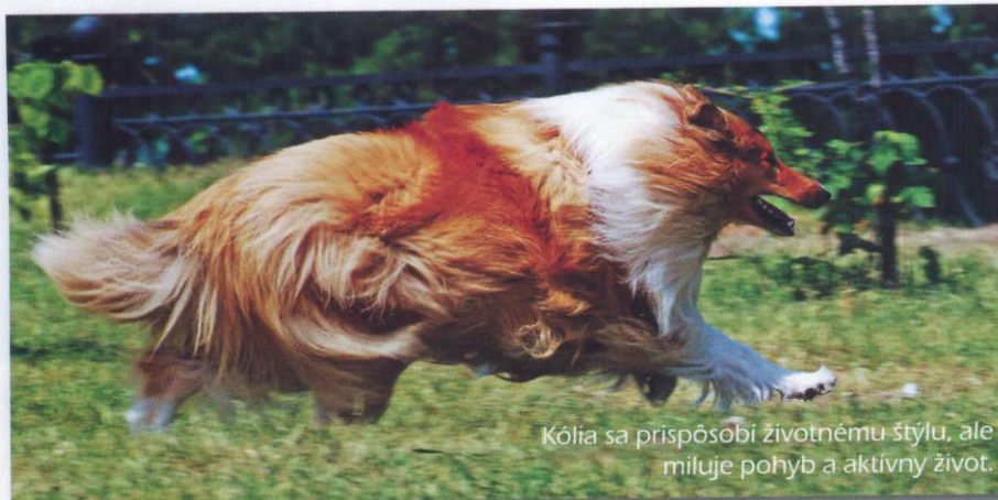
Kólia sa prispôsobí životnému štýlu, ale miluje pohyb a aktívny život.