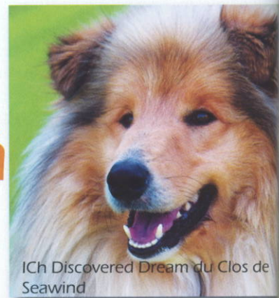
Ich Discovered Dream du Clos de Seawind

Kólia dlhosrstá budí pozornosť svojim atraktívnym zjavom, avšak najväčšou prednosťou tohto psieho krásavca je bezpochyby jeho povaha. Hlavne vďaka nej bola kólia po stáročia vysoko cenená vo svojej domovine na Škótskej vysočine, kde si plnila úlohy ovčiarskeho psa. Práve obdiv k povahe a pracovným schopnostiam viedli kráľovnú Viktóriu k jej pozdvihnutiu od stád oviec na anglický kráľovský dvor. Aj legendárna Lassie okúzliла vtedajší svet svojimi schopnosťami – inteligenciou, vernosťou k rodine, vytrvalosťou a dobrou pamäťou. A to sú presne vlastnosti, ktoré z tohto plemena robia v dnešnej dobe ideálneho rodinného psa.