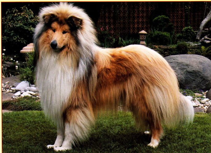
Top pracovná dlhosrstá kólia - JCh. Nyitrameni Brother Louie

Za rok 2009 boli odovzdávané ocenenia nielen pre Top jedinca klubu, plemena, juniora, či