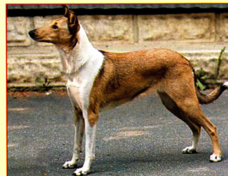
Top junior krátkosrstá kólia - Ch. Shulune Imperial Signature

chovateľskej stanice, ale prvýkrát sa súťažilo aj o top veterána a top pracovného psa. Dôvodom otvorenia súťaže pre pracovne vedených jedincov je ich zvyšujúci sa počet a dosahované úspechy na poli agility, pracovných skúšok, canisterapie a pod. Tieto aktivity