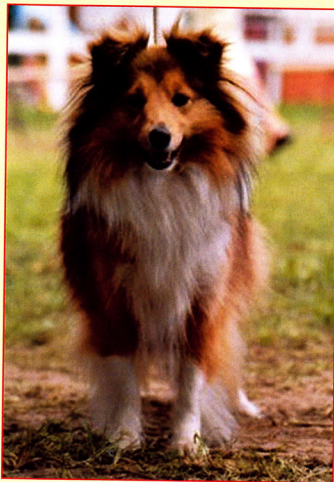
Top veterán šeltia - Vet.Ch

sú veľmi vítané, nakoľko sú veľkým prínosom pre naše plemená.