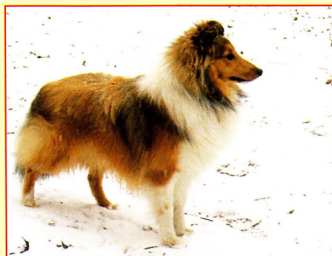
Top junior šeltia - Embargo z Dáblvy studánky

Tak, ako je už viacero rokov dobrým zvykom, v Klube chovateľov kólií a šeltií aj v uplynulých dňoch došlo k zbilancovaniu úspechov jedincov v majetku členov klubu za uplynulý rok.