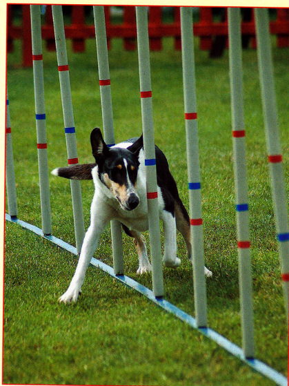
Top krátkosrstá kólia - Baltica Bila Kaifá