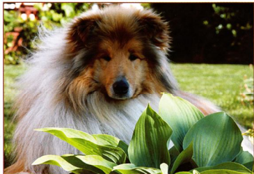
Ch. Nyltremant Yekaterina Empress

zasnenosti, sladkosti, ušľachtilosti, bystrosti, jemnosti s určitou dávkou iskry a šibalstva. Pomer medzi týmito vlastnosťami musí byť veľmi vyvážený. V opačnom prípade môžeme sledovať výrazy netypické pre dlhosrsté kólie s náznakmi tvrdosti, ostrosti, alebo psov bez výrazu.