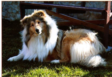
JunCh. Discovered Dream du Clos de Seewind