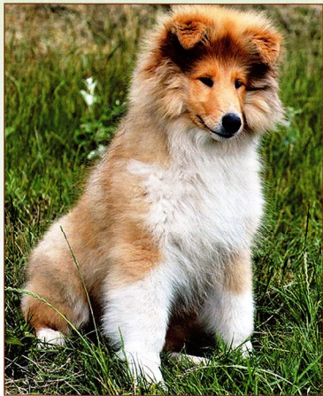
Šeňo pes (3 mesiace) - HUJunCh, SKJunCh - Nyltremant Brother Louie